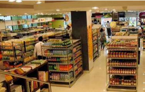
GAINING MARKET. The recent GST rate reduction is a welcome structural reform that will strengthen long-term consumer demand

Despite the headwinds from the GST transition and continued macroeconomic challenges in Indonesia, the quarter was resilient, said