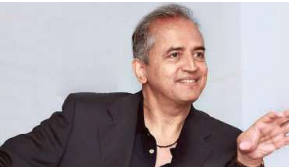
HEALTHCARE MARKET ACCESS. Dr Devi Prasad Shetty, Chairman, Narayana Health

The company eventually finalised the acquisition of Practice Plus Group, purchasing 60,001 equity shares at ₹3,146.29 per share (face value ₹0.02 each). This marks Narayana Health’s second international expansion after establishing